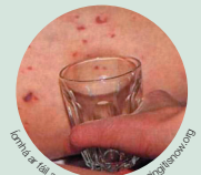
Lámha ar láil ag Meningitis Now meningitisnow.org

D'fhéadfadh go mbeadh an gríos níos deacra a fheiceáil ar chraiceann dubh nó donn. Seiceáil limistéir níos éadaí cosúil le bosa na láimhe nó boinn na gcosa, díon an bhéil, bolg, bána na súl nó taobh istigh de na spéaclaí.