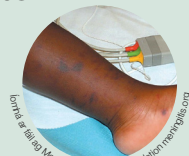
Lámha ar láil ag Meningitis Research Foundation meningitis.org