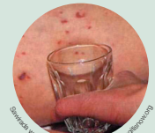
Sharraxaada waxay bixiyaay Meningitis Now meningitisnow.org

Waxaa laga yaabaa inay adkaato in finanka laga arko maqaarka madow ama buniga ah. Hubi meelaha cadcad sida calaacalaha gacanta ama dhanka hoose ee cagaha, saqafka afka, caloosha, qaybaha cadaanka ah ee indhaha ama gudaha indhaha.