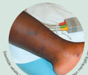
Sharraxaada waxay bixiyaay Meningitis Research Foundation meningitis.org