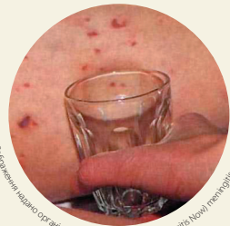
Зображення чашки орг. акадмією «Менінгіт зараза» (Meningitis Now) / meningitis.org

Висип може бути важче побачити на чорній або коричневій шкірі. Перевірте блідіші ділянки, як-от долоні або підшви ніг, піднебіння, живіт, білки очей або внутрішню частину повік.