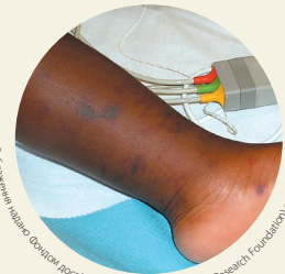
Зображення лікаря Фонду дослідження менінгіту (Meningitis Research Foundation)