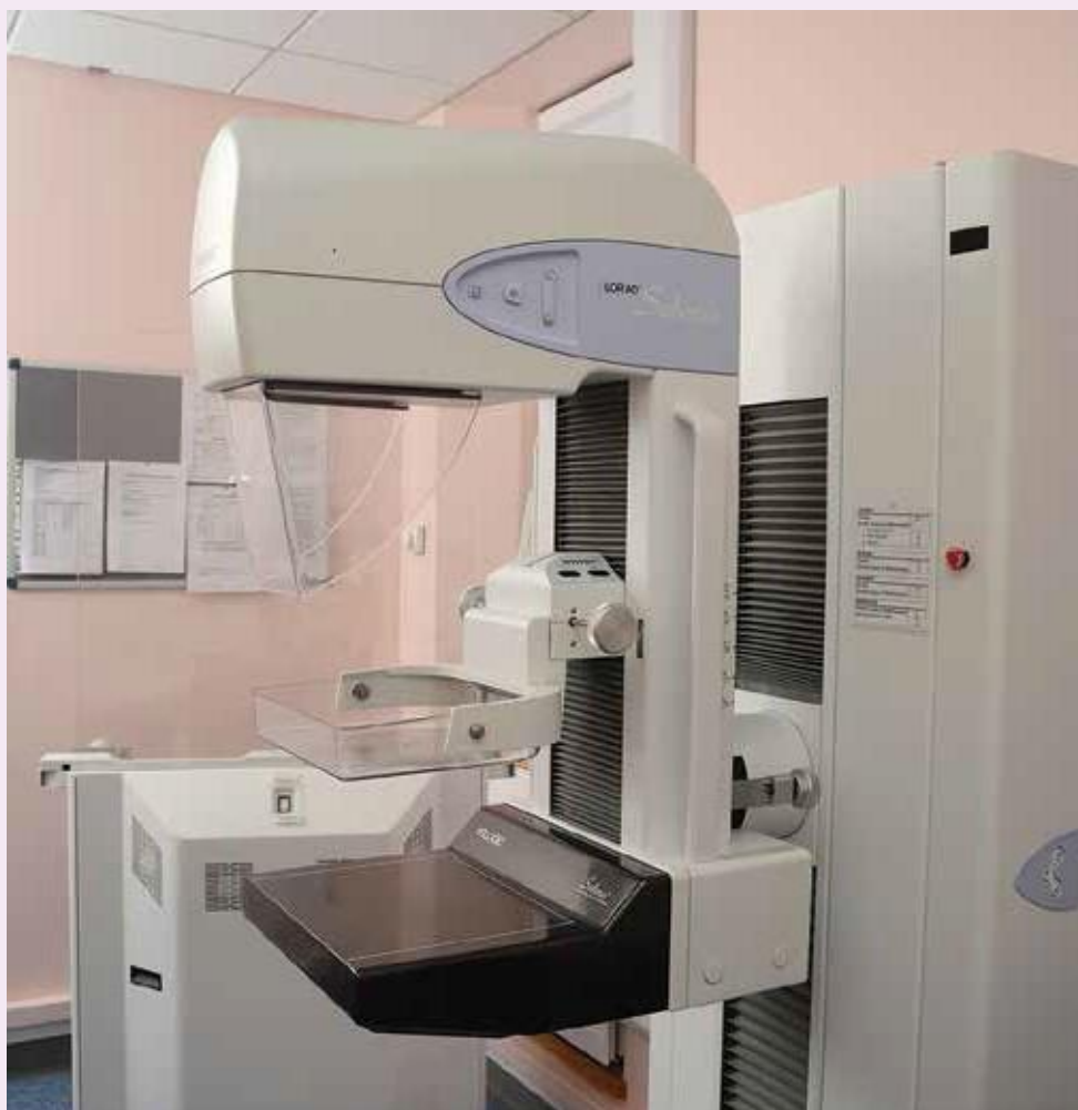
Mákina mamografia dijital